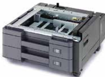
MAGASIN PAPIER 2X 500 FEUILLES PF-7100 Idéal pour les formats papier de l'A6 à SRA3 (320 x 450 mm).