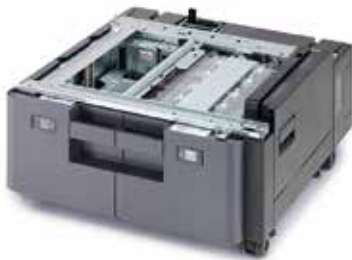
MAGASIN PAPIER 2 X 1500 FEUILLES PF-7110 Prise en charge des formats A4, B5 et lettre.