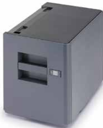
MAGASIN PAPIER 3000 FEUILLES PF-7120 Idéal pour les gros volumes d'impression au format A4.